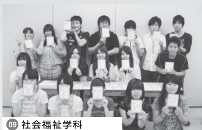
09 社会福祉学科 楽しく理解!「福祉かるた」