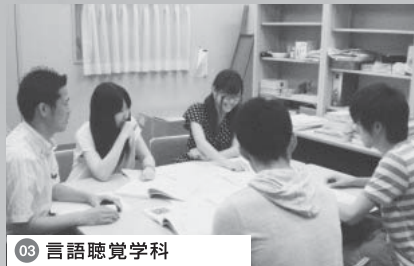
03 言語聴覚学科 「言語聴覚士の歴史」のポスター作成