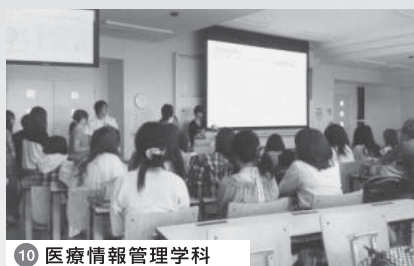
10 医療情報管理学科 製氷菓子の費用対効果についての発表