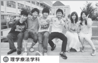
01 理学療法学科 「くだらないことでも全力に!」がモットー