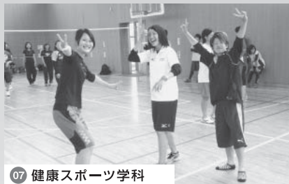
07 健康スポーツ学科 盛り上がったバレーボール大会