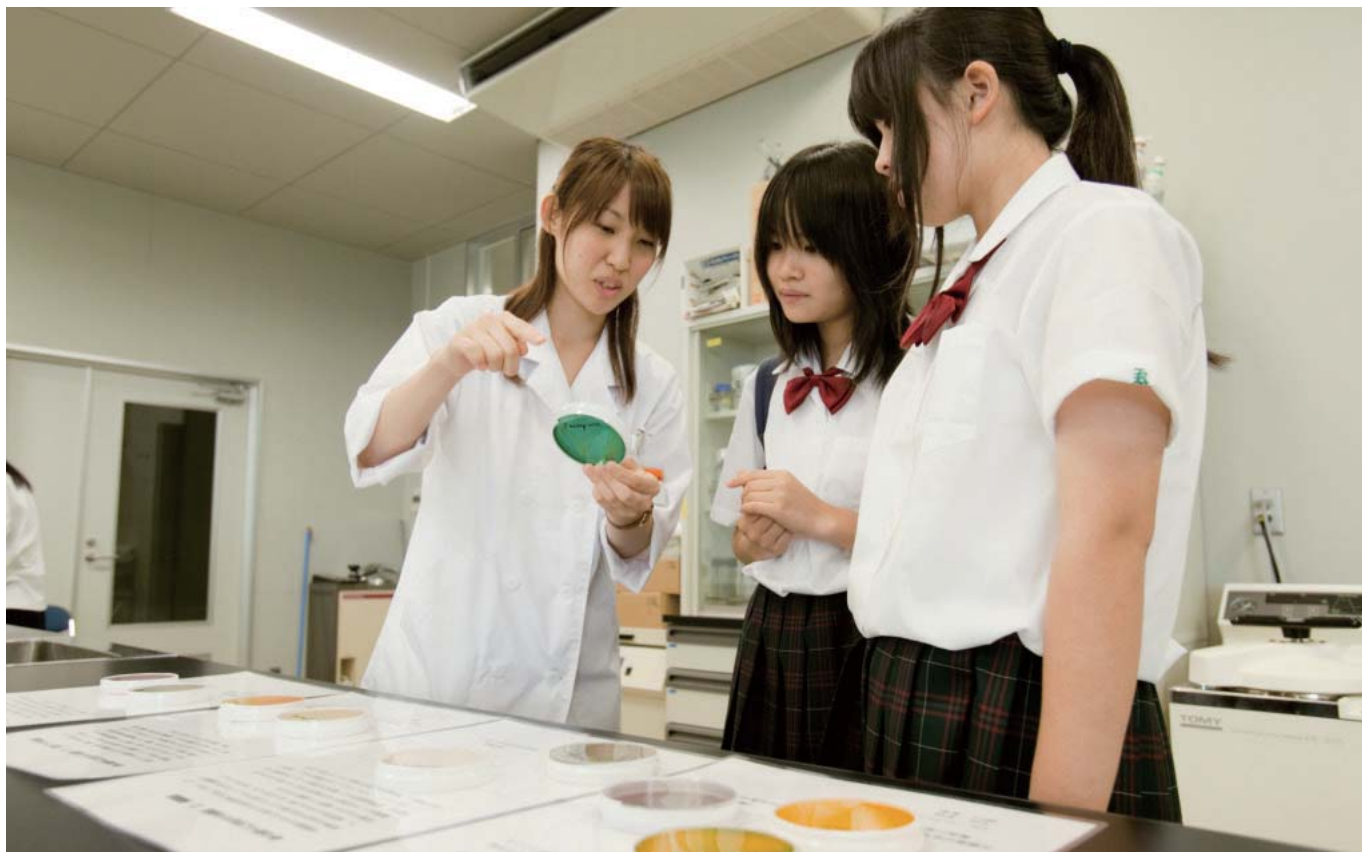
7月、8月、9月に「オープンキャンパス2012」が開催されました。県内外から約3,800名の方々にご来場いただき、大変賑やかなイベントとなりました。