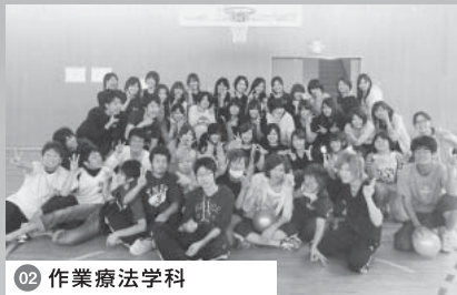
02 作業療法学科 ゼミ対抗ドッジボール大会