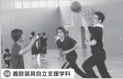
04 義肢装具自立支援学科 楽しむときは、全力で楽しむ!

基礎ゼミ 学生・教員交流会 基礎ゼミは1年生の全学生を対象に行われる少人数制のゼミです。学生は7~8名程度のグループに分かれ、各グループを教員1名が担当します。ゼミでは、健康で充実した大学生活を送るための基本的な能力を育むことを目的に、大学での学習方法や心構えなどを指導します。またディスカッションを数多く取り入れ、友人づくりやコミュニケーションの場としても活用されます。