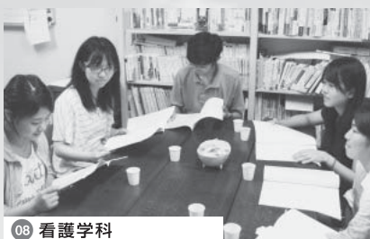
08 看護学科 「ターミナル・ケア」について、意見交換