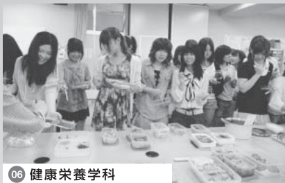
06 健康栄養学科 持ち寄りのお弁当をバイキング形式で食べました!