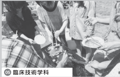
05 臨床技術学科 大成功に終わったバーベキュー

基礎ゼミ 学生・教員交流会 基礎ゼミは1年生の全学生を対象に行われる少人数制のゼミです。学生は7~8名程度のグループに分かれ、各グループを教員1名が担当します。ゼミでは、健康で充実した大学生活を送るための基本的な能力を育むことを目的に、大学での学習方法や心構えなどを指導します。またディスカッションを数多く取り入れ、友人づくりやコミュニケーションの場としても活用されます。