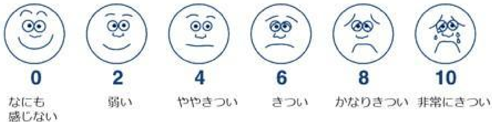
図1 「運動強度フェイススケール」