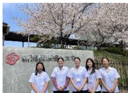
【マヒドン大学から来校した学生たち】