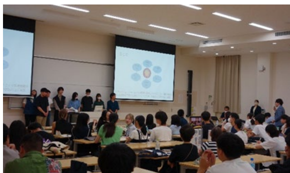
【学科混成チームでディスカッション】

連携総合ゼミでは、本学学生のみならず新潟薬科大学、新潟リハビリテーション大学等の県内他大学やセサント・トーマス大学（フィリピン）等の海外提携校からも参加いただき、本学の履修学生156名に加え、同窓生や大学院生も参加し、これまでの臨床経験等を生かした学部生へのアドバイスなどが行われました。こうした活動を通じて、参加学生からは「自分の専門職種への理解だけでなく、他職種の視点にも触れながら理解を深めることができた」との意見が寄せられるなど、充実したゼミ活動を実践することができています。