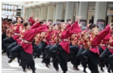
【全52のクラブ・サークルが活動】