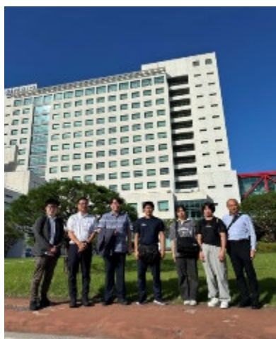
【韓国研修 (嘉泉大学訪問)】