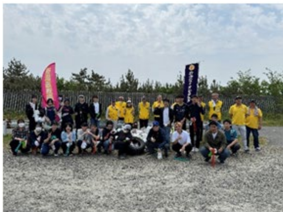
【島見浜ごみ拾い活動】