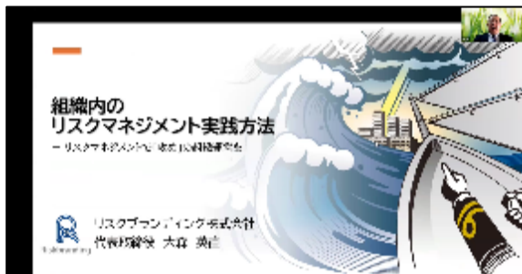
【リスクマネジメント研修の様子】