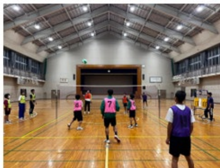
【放課後スポーツタイム】