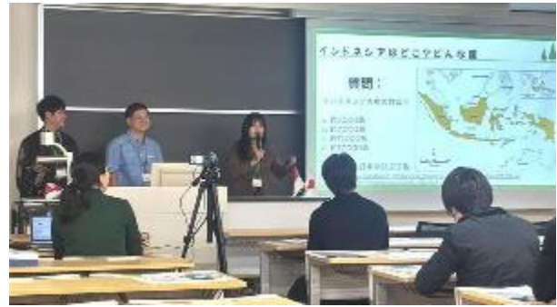
【新潟県委託事業「国際理解セミナー」にてインドネシア出身留学生が発表】