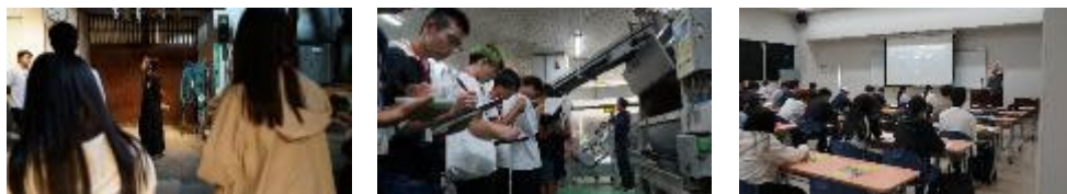
【インターンシップⅠの様子】

新潟中央青果市場株式会社、ピア Bandai、今代司酒造株式会社、片山食品株式会社、富士美園株式会社、道の駅加治川