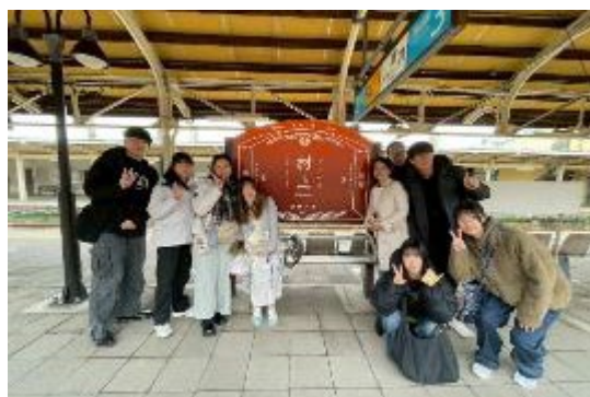
【中山医学大学から来校した学生たち】