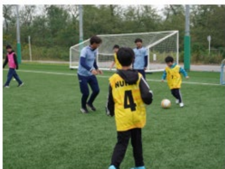
【NUHWスポーツフェスタ】