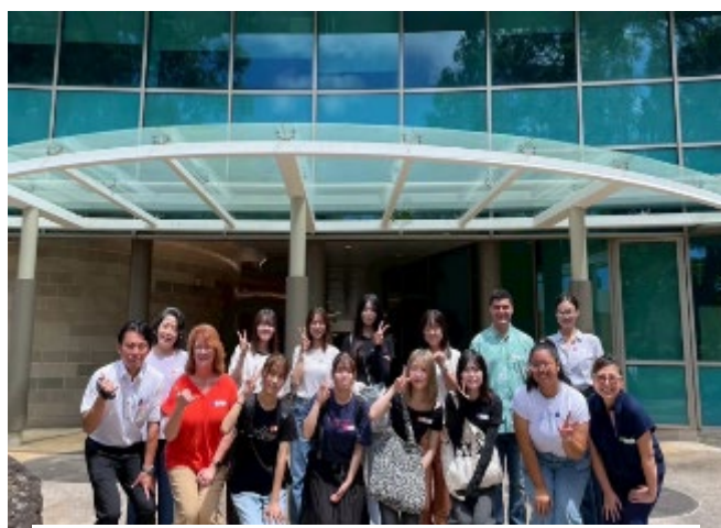
【アメリカ研修 (ハワイ州立大学訪問)】