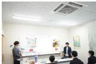
【NAFU JOB 博の様様（企業ブース）】