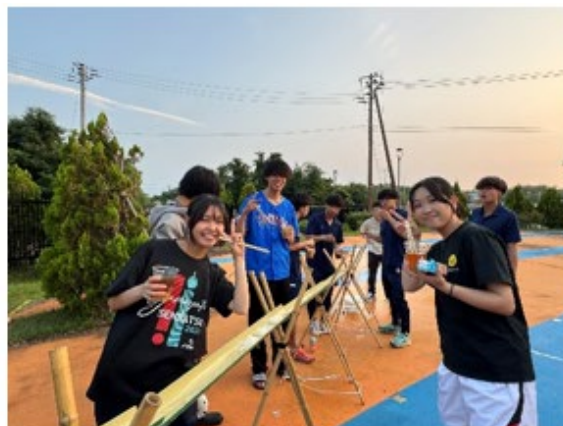
【七夕祭り流しそうめんの様子】