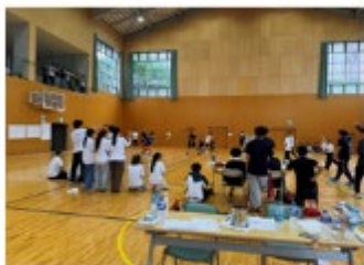
【2025年度 スポーツ大会】