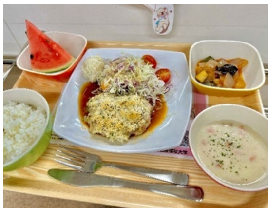
【同窓会の助成による300円ランチ】

また、 キャンパス内へのキッチンカーの誘致や同窓会の助成による300円ランチの提供など、学生の声から生まれたアイデアも積極的に取り入れています。 同様な支援として、独立行政法人日本学生支援機構の助成金をもとに、お米など物価高騰の影響を受ける学生の支援として100円ランチを実施しました。