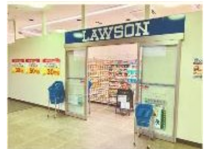
【胎内キャンパス厚生(L)棟 1Fで営業】