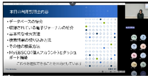
【『Business Source Elite』説明会の様子】