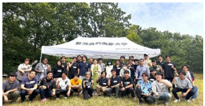
【留学生&日本人学生交流会実施】

2025年度の退学発生率は3.7%となり、昨年度の4.1%からやや減少となりましたが、これまでの取り組みおよび退学要因等を詳細分析し、より効果の高い対策・対応へと改善することで次年度以降の退学者減少に結び付けていきます。