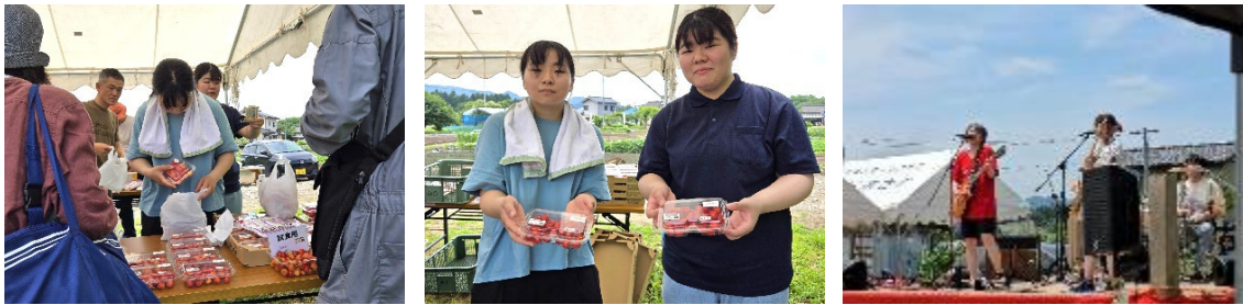
【さくらんぼまつりのボランティアに学生が参加】

大須戸村づくり協議会と連携し、さくらんぼの栽培、収穫体験、さくらんぼまつりへの本学学生の派遣を行いました。