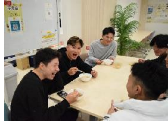
【芋煮会等の学生イベントを開催】