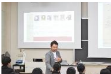
【NAFU JOB 博の様様（立川様講演）】