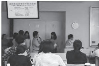
▶発表会当日の様子