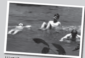
川で泳いでみました