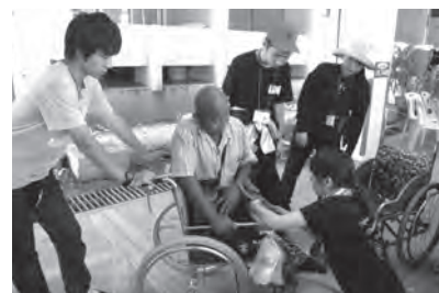
国内の中古車いすを回収・修理・整備し、発展途上国や被災地に届ける「空飛ぶ車いすサークル」

国際交流委員会は、国際交流活動や海外研修の機会を増やすことに注力していますが、これらの機会を「能力発見」を助ける手段として考えると、「そこに参加してみよう」と学生が踏み出した段階でその目的の70%は達成されていると思います。「踏み出せる自分」がまさに「セルフスターター」であり、私が本学で多く目にしたい学生です。社会は我々個人の意図や努力とは無関係に「国際化」していきます。その社会の中で自分の能力を発揮する人は、自然に「国際人」になります。「急がばまわれ」です。