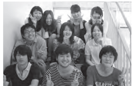
▶ゼミメンバーとの集合写真