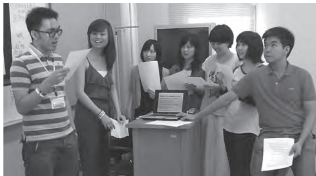
大学間国際交流の協定を締結しているフィリピンの大学生との交流

そういった意味で、本学の教育の特色の一つである「連携」は地域、場所を選ばずますますその重要性を増すばかりであることが分かります。学生のみなさんが、学生のうちに、あるいは専門職者となってからどのような場面で国際交流・国際貢献に関わるかは様々でしょうが、どの場面においても本学で培った「連携を作り上げる力」を存分に発揮してもらいたいと思います。