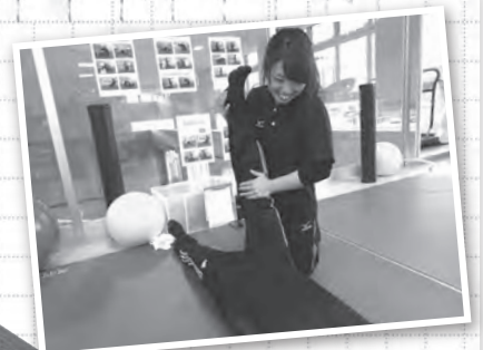
医療法人 愛広会 メディカルフィットネス ロコパーク 【健康運動指導士】

本学科では、健康運動指導士はもちろん、スポーツ・健康・教育に関連する様々な資格を自分の将来に合わせて取得することができます。新しい環境に飛び込む時は必ず不安がつきものですが、自分の夢を達成できるように自分の力を信じて頑張ってください!