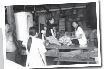
訪問リハビリテーションに同行

国際交流委員会企画の海外研修は参加者と一緒につくり上げる研修です。今後の活動にご期待ください。