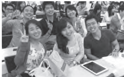
▶連携総合ゼミ発表会当日