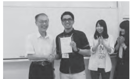
▶学長より修了証授与