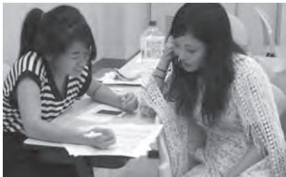
▶英語で患者様の治療についての話し合い

発表会は、グループごとに、メンバー全員で話し手を交代しながら、英語と(フィリピンの学生の)日本語を交えて、見事にやり遂げました。ただでさえ緊張する発表を、英語で行ったということは、学生たちにとって大きな自信につながったと考えます。