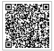
視聴申込みはこちら (詳細は裏面へ)